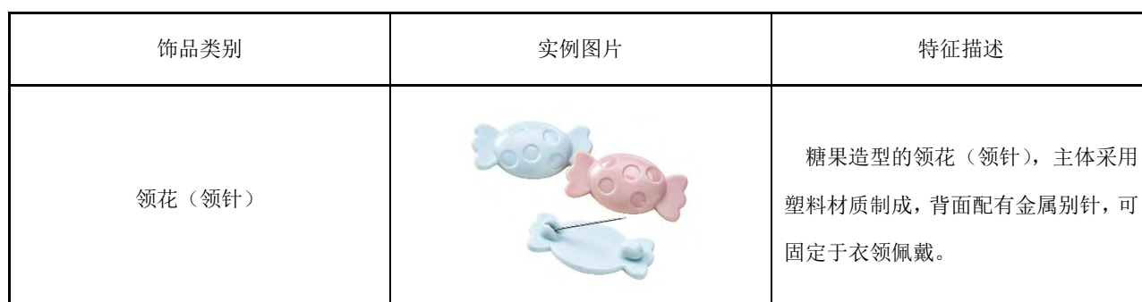
表B.8 儿童用服饰产品实例