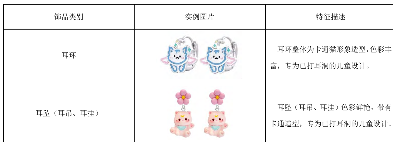
表B.2 儿童用耳饰产品实例