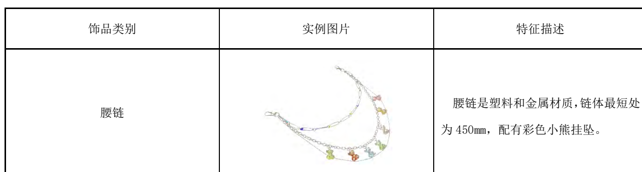
表B.5 儿童用腹饰产品实例