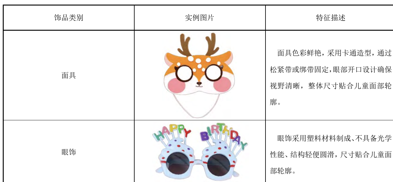
表B.3 儿童用面饰产品实例