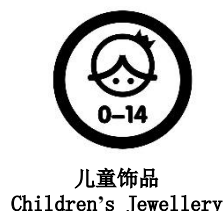
图1 儿童饰品图形标识