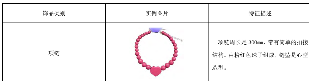
表B.4 儿童用颈饰产品实例