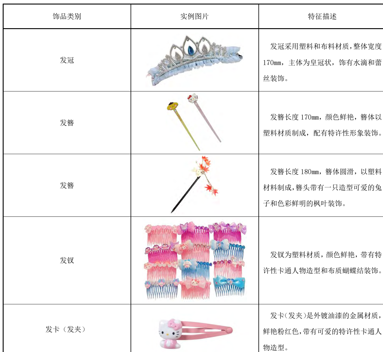
表B.1 儿童用发饰产品实例