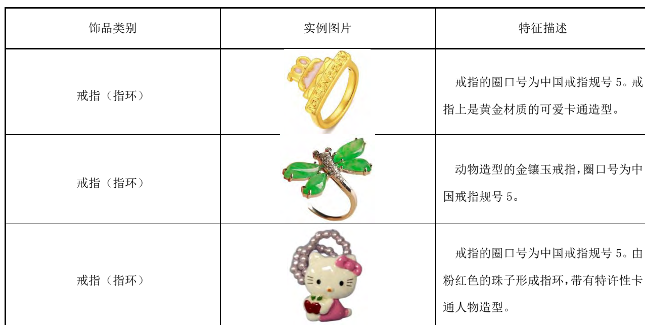
表B.6 儿童用手饰产品实例