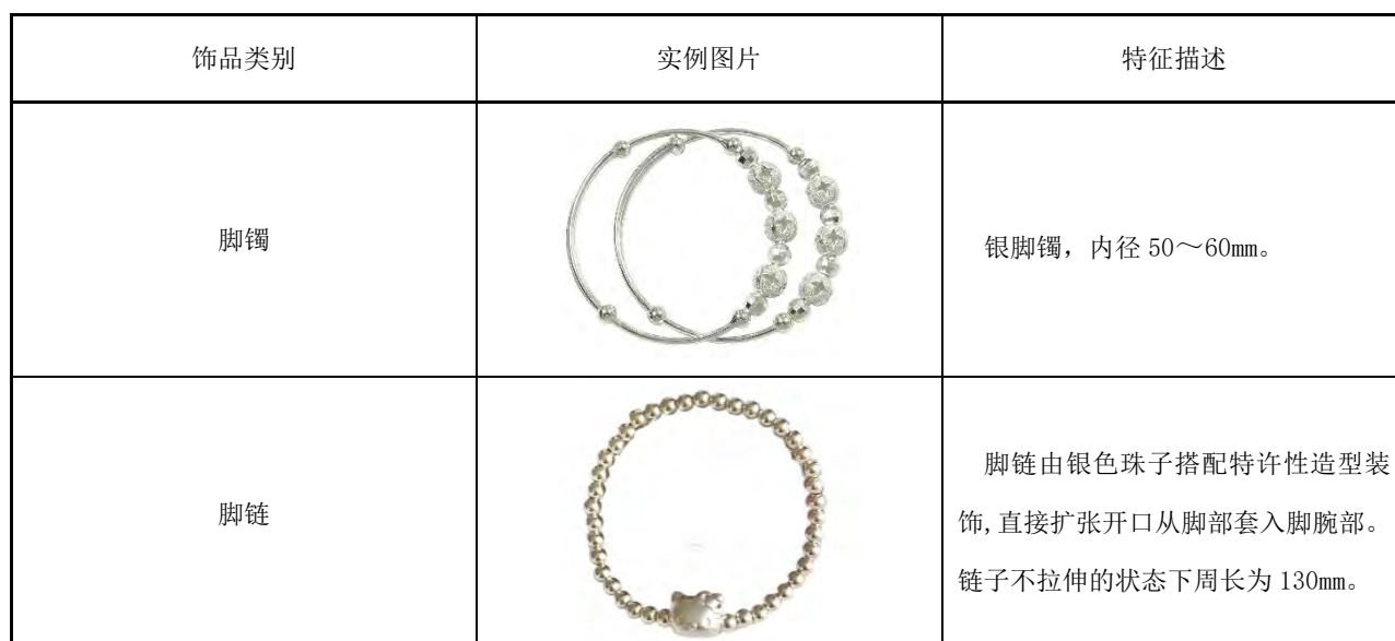
表B.7 儿童用足饰产品实例